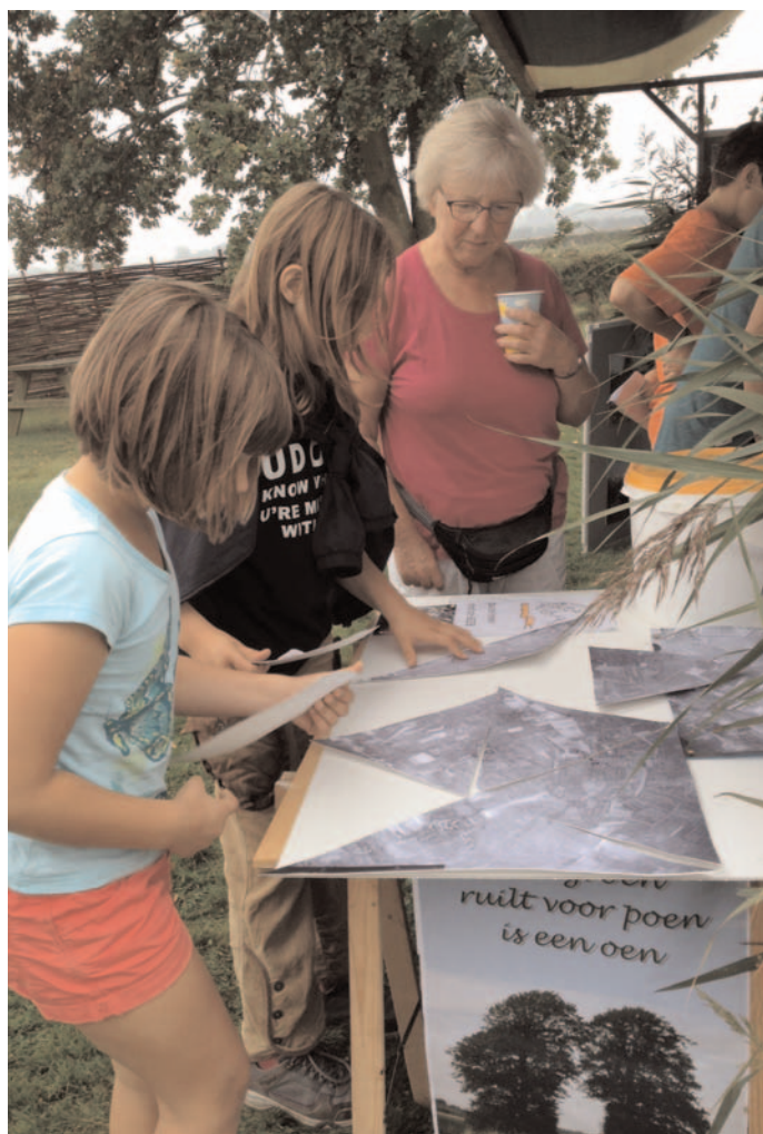
BZZB activiteit voor jong en oud op Erfgoeddag in het Landschap 20 september Hoeve van der Meulen, zie www.bzzb.nl/actueel