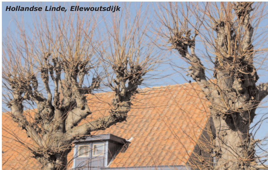
Hollandse Linde, Ellewoutsdijk

Verder hebben wij gewezen op de noodzaak van een goede handhaving. Het opstellen van de lijst van waardevolle bomen mag geen papieren tijger zijn. Er moet actief worden gecontroleerd en het moet duidelijk zijn hoe overtredingen bestraft worden. Wij pleiten ervoor om het via de gemeentelijke website of een speciale app (zoals voor Borsele Buiten Beter) makkelijk te maken boomproblemen te melden.