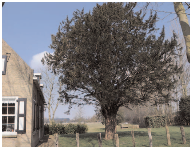
Taxus of Venijnboom, Oude Zanddijk Heinkenszand