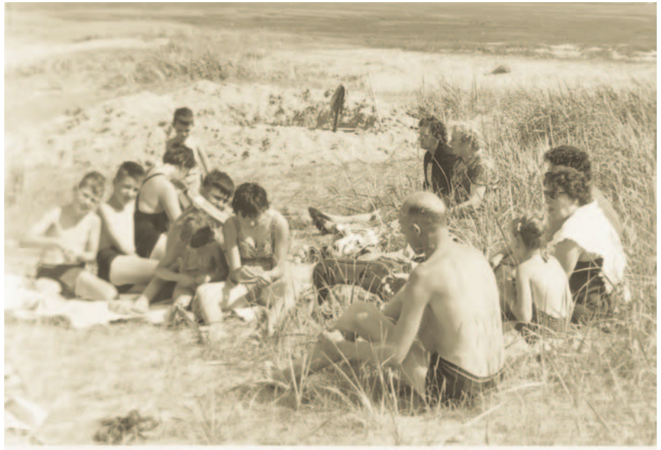
Pinda's eten aan De Kaloot