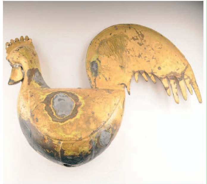
Vergulde zinken haan (windhaan) afkomstig van de kerktoren van de oorspronkelijke kerk van Ellewoutsdijk die tijdens de bevrijding van Zuid-Beveland door de geallieerden vernietigd is omdat de Duitsers deze toren gebruikten als observatiepost.