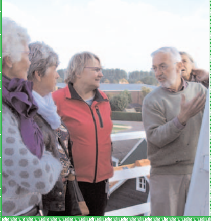
2015 molen Heinkensand