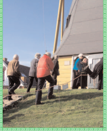
2007 molen Borssele