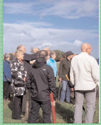
2010 Hoeve Van der Meulen 's-Heer Abtskerke