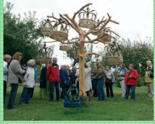
2009 tuin Heuvelhof Baarsdorp