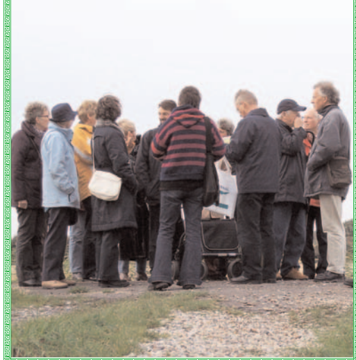
2008 bodemonderzoek Nisse