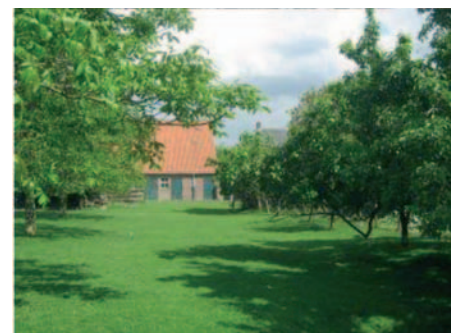
Een geschikt steenuilen erf