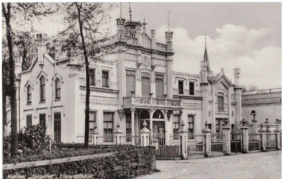
Kasteel „Zorgvliet“, Ellewoutsdijk