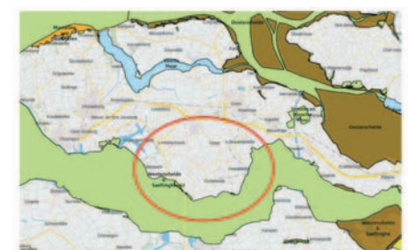
Figuur 1. Ligging plangebied (rode cirkel is globaal) t.o.v. Natura 2000-gebieden (bron: AERIUS Calculator)

begin dat ze altijd belanghebbend is als er iets in het Borsele buitengebied gebeurt. Dat neemt niet weg dat we immer constructief zullen samenwerken. In de aanloop naar het Omgevingsplan, dat in 2017 moet gaan vigeren, zullen we dan ook regelmatig bij de gemeente aanschuiven.