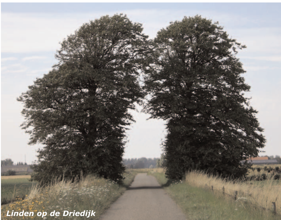
Linden op de Driedijk

De donateurs zijn voor ons als bomen, ze steunen en versterken ons. Ze houden de BZZB gezond en vitaal. Het bestuur dankt al haar trouwe donateurs weer voor hun bijdrage. Bent u nog vergeten uw jaarbijdrage voor 2016 (tenminste € 8,- ) over te maken, doe het alsnog. Het rekeningnummer vindt u in de kop van deze mei nieuwsbrief. Onze financiën worden goed beheerd en verantwoord, dankzij onze penningmeester! We denken al weer na over de invulling van de donateur dag. Daar hoort u over in de volgende nieuwsbrief.