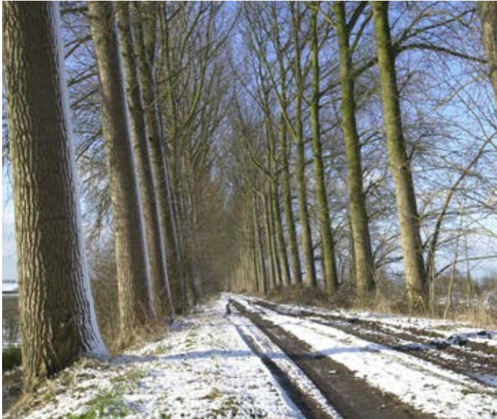
Nisse, Zwaakse Dijk

Ook hier hollebollige weilanden en drinkpoelen. Buitendijks in de Westerschelde liggen de steeds zeldzamer wordende schorren en slikken.