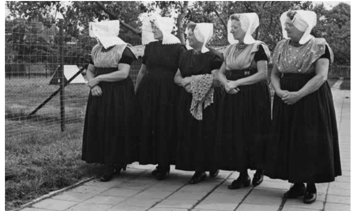
Excursie in kader streekverbetering 1958

De prognose blijkt later zeer overdreven, maar de toon is wel gezet. In de vele jaren slepende discussie over de aanleg van een brug of tunnel