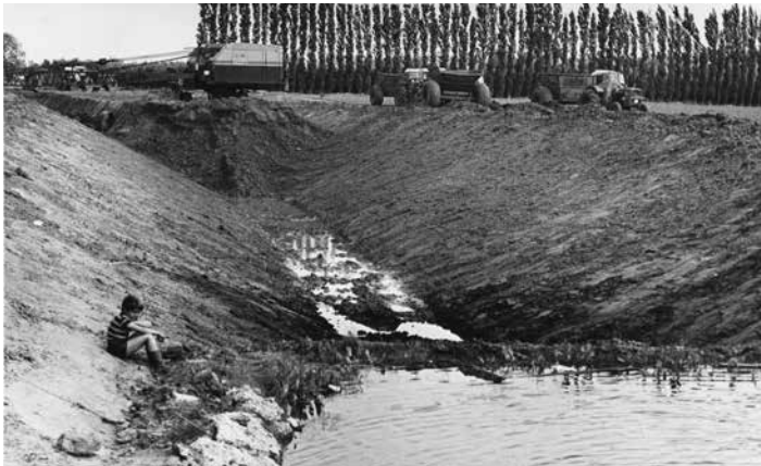
Nisse, aanleg waterloop Drieweg

Daardoor gaan rijke natuurwaarden, vanaf 300 jaar na het begin van de jaartelling ongerept gebeven, voorgoed verloren.