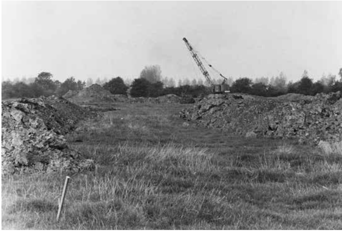
Nisse, egalisatie tijdens verkaveling

Het aantal gebruikskavels zakt van 2890 tot 790, de kavelgrootte stijgt van 2 tot 5,7 hectare. Het areaal grasland vermindert sterk en gemengde bedrijven gaan over op volledige akkerbouw. De veehouderij daalt fors, zowel melk- als mestvee. Door aanpassing van de waterbeheersing (waterlopenstelsel, nieuw gemaal en onderbemaaling, een stuw en aanbrengen drainage) krijgt de ooit plasdrassige Poel een laag boeren-waterpeil.