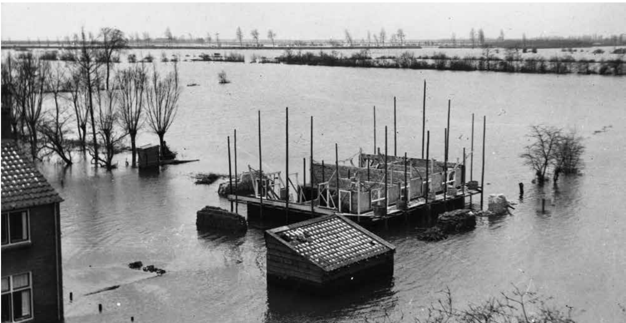
Baarland, watersnoodramp 1953

Wat zijn de gevolgen van het rigoureuze plan? In de Poel en rond Heinkenszand en Nisse verdwijnt de uit de middeleeuwen daterende verkaveling van kleinschalige akkerbouw op de hogere kreekruggen en veeteelt in de lagere kommen. Kronkelige wegen worden verhard, verbreed en rechtgetrokken, wegelingen opgeruimd. Grillige kavels, vaak begrensd door oude getijdenkreekjes worden samengevoegd. Meidoornhagen, knotbomen en oude grenslinden gaan zonder pardon op de brandstapel. Hollebollige graslanden worden volledig geëgaliseerd en gedraineerd.