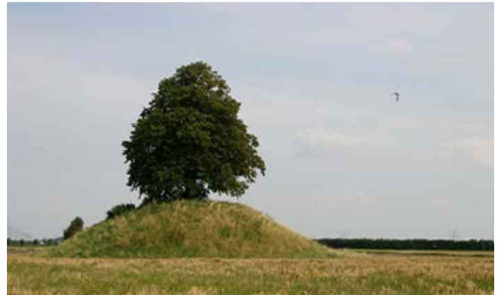
's-Gravenpolder, vliedberg bij 't Hof Blaemskinderen

Al die tijd hebben de vrijwilligers van de BZZB zich het vuur uit de sloffen gelopen om de Zak zoveel mogelijk intact te houden. Met uiteraard in de beginperiode veel aandacht voor het tegengaan van een tunneltracé door de Zak. Daarnaast van meet af aan veel aandacht voor natuur, landschap, milieu en cultuurhistorie in de Poel en de Zak. Niet alleen maar tegenmacht zijn, ook actieve inzet voor het ongeschonden behouden van een uniek gebied. Want in de praktijk lijkt aan de bedreigingen van de Zak nooit een eind te komen. Is het niet door een landinrichting of tunnelaanleg, dan wel door andere menselijke ingrepen.