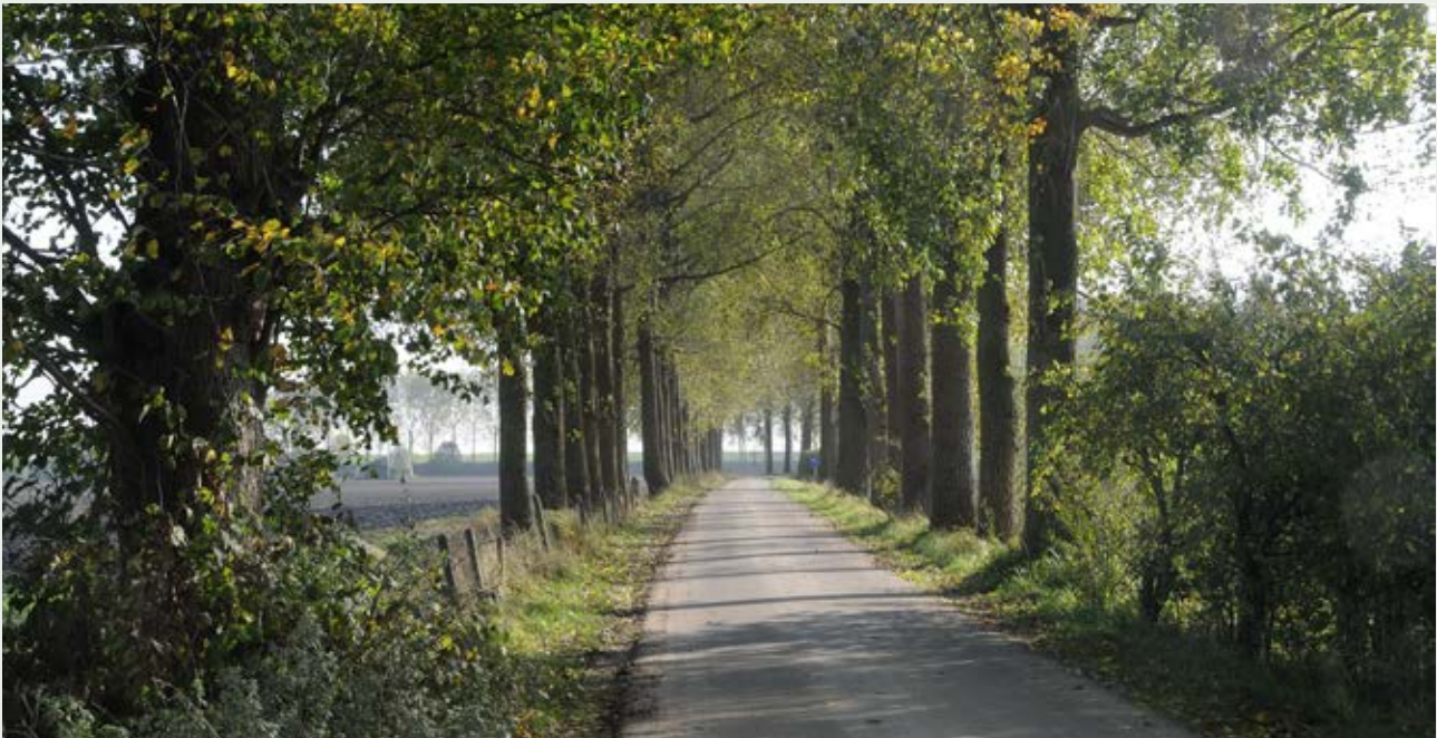
's-Gravenpolder, Nieuwe Hoondersedijk