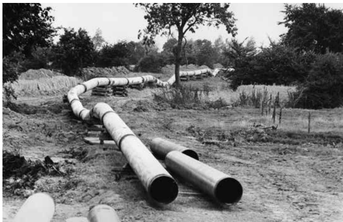
's-Gravenpolder, aanleg pijpleiding bij Koedijk 1973

zeker niet de laatste keer dat de stichting in haar streven de waarden en schoonheid van de Zak te sparen, wordt tegengewerkt. Binnen een half jaar zijn er 600 donateurs. Dat geeft de burger moed.