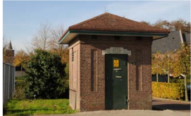
Heinkenszand, PZEM kotje

Borsele is voor menigeen een aantrekkelijke woongemeente. Ook buiten de groeikernen Heinkenszand en 's-Gravenpolder wordt flink gebouwd. De BZZB vindt dat rekening gehouden moet worden