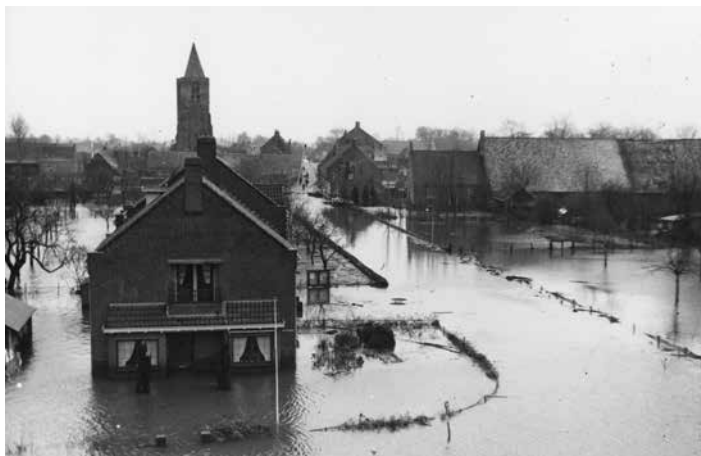
Baarland, watersnoodramp 1953

aanplant met populieren. Tussen half 1953 en eind 1964 wordt in de Zak ruim 4500 hectare heringericht en dat kost 29 miljoen gulden.