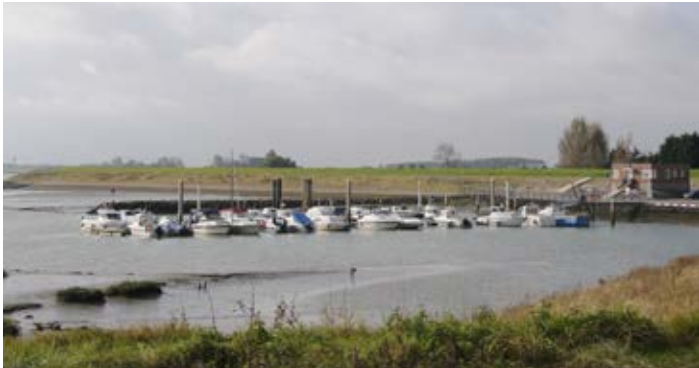
Hoedekenskerke, Haven de Val

organisaties voor natuur- en milieubescherming worden contacten onderhouden, zoals met de vereniging Natuurmonumenten, de Koninklijke Nederlandse Natuurhistorische Vereniging Bevelanden, vereniging Redt de Kaloot en verschillende overheden. Stichting Landschapsbeheer Zeeland steunt de BZZB met raad en daad en de stichting Het Zeeuwse Landschap biedt de BZZB gelegenheid zich te presenteren.