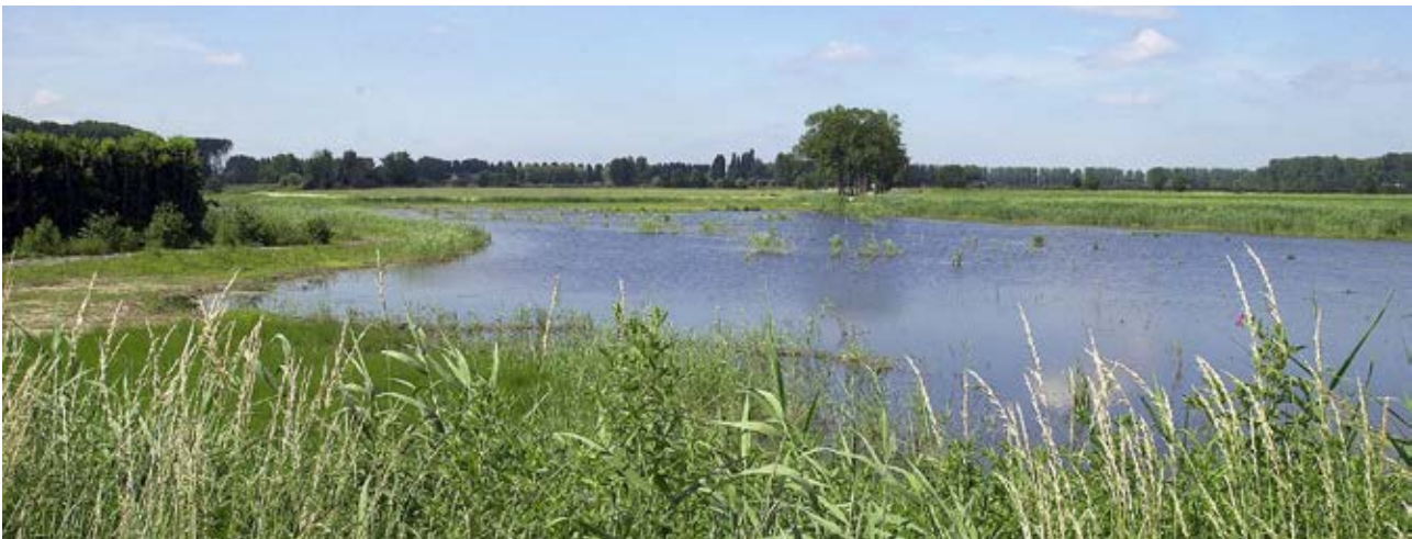
Kwadendamme, Zwaakse Weel